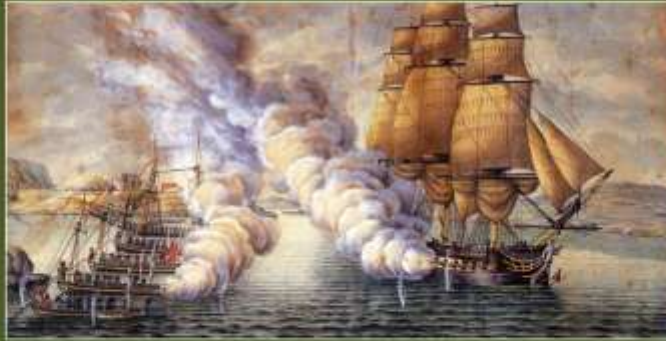
Kaperfarten kunne gi gode inntekter, men det var også en viss fare for at toktene endte med at man selv ble satt i engelsk fangenskap.

Britenes blokade av norske havner gjorde at handelen ble redusert betraktelig. Imidlertid oppstod det en ny næringsvei som følge av de vanskelige forholdene. Kaperfarten, ble den kalt, en form for lovlig sjørøveri som skulle vare i flere år. For å ta del i kaperfarten måtte kapteinene ha tillatelse fra myndighetene. En slik tillatelse ble kalt for et kaperbrev. Dette gav rett til å kapre og erobre fiendtlige handelsskip. På denne måten skulle man svekke fienden og styrke ens egen posisjon. Rundt omkring i norske byer vokste det etter hvert fram en rekke kaperselskap. Kapervirksomheten var svært innbringende når den lyktes, men det var også en viss risiko for at toktene kunne ende med at man selv ble satt i engelsk fangenskap. Og i og med at de fleste menn nok hadde en familie å forsørge, kan vi tenke oss at det ikke bare var enkelt å forholde seg til de vanskelige realitetene som rådet.