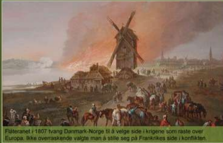
Flåteranet i 1807 tvang Danmark-Norge til å velge side i krigene som raste over Europa. Ikke overraskende valgte man å stille seg på Frankrikes side i konflikten.

Flåteranet i 1807 tvang Danmark-Norge til å ta stilling i krigene som raste over Europa. At man valgte å stille seg på Frankrikes side, var neppe overraskende. Imidlertid skulle valget få fatale konsekvenser for Norge.