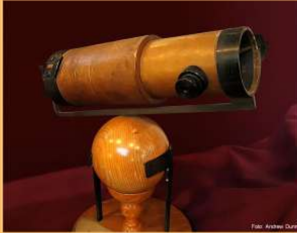
Bilde: Teleskop laget av Newton.