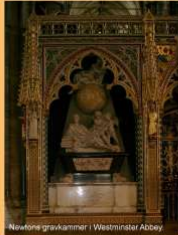
Newton's gravkammer i Westminster Abbey.

"Dersom jeg har sett litt lengre enn andre, så har jeg gjort det ved å stå på kjempers skuldre." Sir Isaac Newton