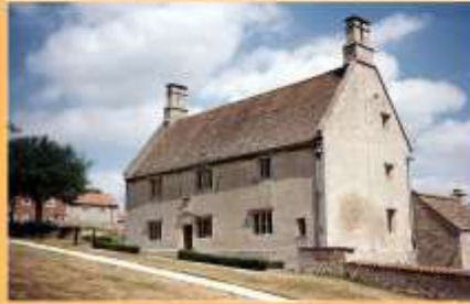
Bildet viser Isaac Newtons fødested i den engelske landsbyen Woolsthorpe.

Isaac Newton ble født i Woolsthorpe, en landsby femten mil nord for London, i 1642. Hans forfedre hadde gjennom generasjoner arbeidet seg opp fra å være fattige bønder til å bli velstående jordeiere. Familien eide både jord og dyr, men det påstås at den boklige lærdommen var mer fraværende – i alle fall på farsiden. På morssiden kunne man vise til en onkel som hadde studert ved Cambridge og senere blitt sogneprest. Isaac Newtons far døde tre måneder før gutten ble født. Selv var Isaac svært svakelig som spedbarn; han ble født før termin og de færreste gav ham gode sjanser til å overleve. Men Isaac hadde tydeligvis kampvilje, for gutten vokste opp. Da Isaac var tre år gammel giftet moren seg på nytt. Hun forlot hjembyen og lot barnet bo hos besteforeldrene. I ni år, fram til stefaren døde, var Isaac atskilt fra sin mor. Først fikk han skolegang i landsbyskolen, senere ble han sendt til skole i nabobyen Grantham. På skolen studerte man latin, gresk og regning. Newton var tydelig en intellektuell begavelse. Han skilte seg ut fra de andre guttene, og gikk ikke særlig godt overens med dem.