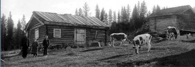
Slik utkastelse var likevel ikke vanlig. Bonden ventet som regel til husmannen og kona var døde før han lot husmannsplassen bli en del av gården.

Det hendte nok likevel at bønder utnyttet sin overlegne posisjon på ufint vis. For tidene var knappe, og den husmann som ikke klarte sine forpliktelser ovenfor bonden var i prinsippet ille ute. Dersom det for eksempel manglet noe på den årlige betalingen, hjalp det lite at husmannen hadde lagt ned et livs innsats på å rydde skog, pløye åker og reise hus. Bonden kunne si ham opp og la plassen bli en del av sitt eget gårdsbruk eller leie den ut til en ny familie. Husmannen måtte i så fall forlate sitt livsverk, kanskje måtte han ut å tigge. Likedan kunne det innebære en viss risiko å bli gammel, for det fortelles om gamle husmenn og enker som måtte underholdes av fattigkassen. Likevel er det mye som tyder på at utkastelse ikke var vanlig. Som regel ventet bonden til husmannen og kona var døde før han inkorporerte plassen til gården.