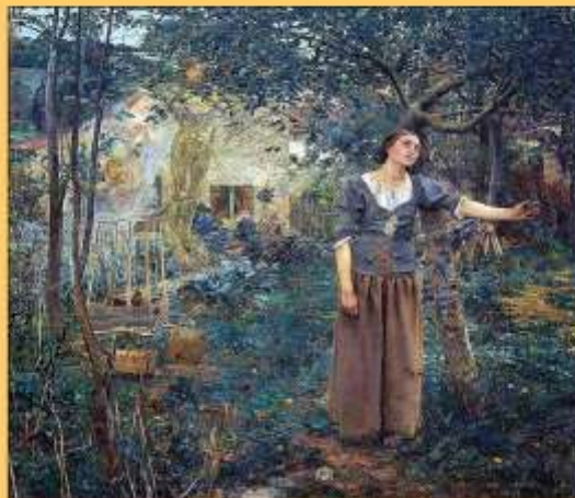
Maleri fra 1800-tallet: Jeanne d'Arc.