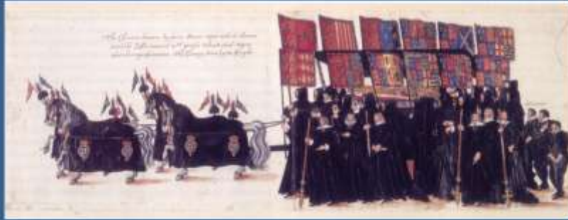
I 1603 døde dronning Elizabeth 1. Hun hadde da sittet på den engelske tronen i 45 år.

I sine siste år opplevde Elizabeth 1 at flere av hennes nærmeste venner, medarbeidere og favoritter døde. Alderdommen ble ensom, men hun var likevel svært elsket av det folket hun regjerte over. I 1603 døde jomfrudronningen etter å ha sittet 45 år på den engelske tronen.