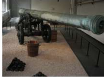
Dronningens lommepistol. Kanonen kunne skyte kuler som veide fem kilo og treffe mål som var to kilometer unna.

Engelskmennene hadde god tilgang på jern, og under Elizabeth 1s styre skulle produksjonen bli mangedoblet. For jernet hadde mange bruksområder, ikke minst innenfor våpenproduksjon, deriblant kanoner. Men jernproduksjonen krevde ved, og dette bidro til at store skogsområder ble hogd ned. Det var derfor en løsning at man i løpet av 1500-tallet gikk over til å fyre med kull. Snart gikk det store skip fra gruvene i nord til London. Det ble opplært nye sjøfolk, og handelsflåten vokste.