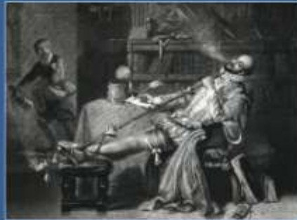
Walter Raleigh introduserte tobakken til Europa. Å røyke pipe ble etter hvert populært.

Englands befolkning levde under varierende kår. Perioden var likevel generelt sett preget av at landet unngikk hungersnød og sultkatastrofer.