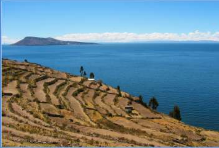
Bilde: Terrassejordbruk i inkariket.