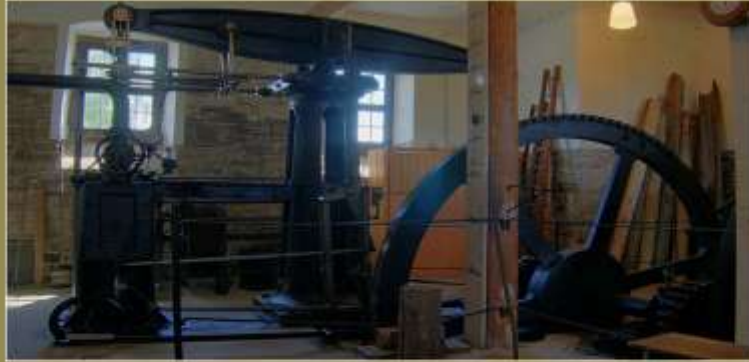
Dampkraften gjorde at man kunne produsere mye mer enn tidligere.

I det man nærmet seg slutten av 1700-tallet ble dampkraften for alvor tatt i bruk. I utgangspunktet hadde dampmaskinene blitt brukt til å pumpe vann ut av dype gruveganger, men etter hvert skulle de altså få flere og mer omfattende bruksområder. Dampkraften gjorde at man ikke var avhengige av at fabrikkene lå ved elver og fossefall. Nå kunne kraftige dampmaskiner drive spinnemaskinene og vevstolene, og dette gjorde at produksjonen økte betraktelig. I fabrikkene ble produksjonen samlet på ett sted. Den effektive dampmaskinen skulle få en avgjørende betydning på den videre samfunnsutviklingen.