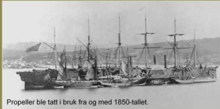
Propeller ble tatt i bruk fra og med 1850-tallet.

Det var ikke bare til lands at dampmaskinen gjorde sitt inntog. I første halvdel av 1800-tallet ble det mer vanlig at dampskip trafikkerte sjø og hav. De første dampskipene hadde skovlhjul som sørget for framdrift. Elvedampere, slik vi kjenner dem fra Mississippi, hadde gjerne et bredt skovlhjul bak. Imidlertid skulle det vise seg at skovlhjulene var lite praktiske, og da særlig til sjøs, siden de hadde en tendens til ikke å tåle sterk sjø, vær og vind. Løsningen på problemet var det svensken John Ericsson som kom med i 1836, da han oppfant den moderne propellen. Propeller ble tatt i bruk fra og med 1850-tallet. I denne perioden ble det ganske vanlig at dampskipene kunne krysse verdenshavene. Noen av dampskipene var både store og luksuriøse, og det ble mer vanlig at de var konstruert i stål eller jern.